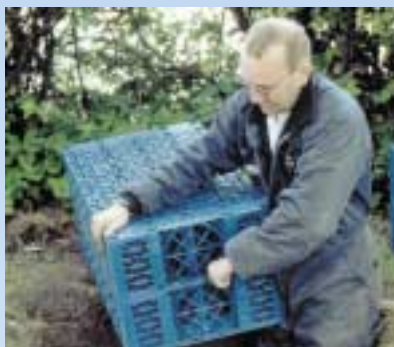
2 Tilslutningshullet i regnvandskassetten skæres fri.