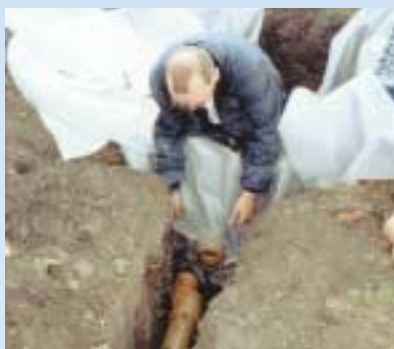
5 Tilslutningen fra regnvandskassetten tilsluttes regnvandsrøret.