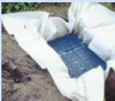
4 Kassetterne installeres i udgravningen, som er foret med geotekstil.