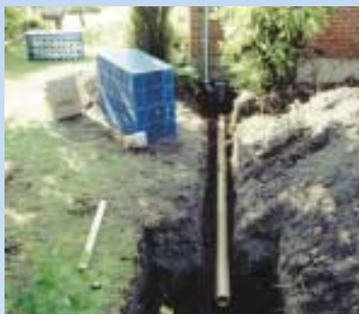
1 Tagbrønd/sandfangsbrønd installeres, og rørene lægges frem til udgravningen til faskinen.