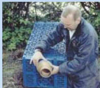
3 Tilslutningen monteres i regnvandskassetten.