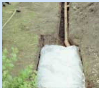
6 Regnvandsmagasinet pakkes ind i geotekstil og dækkes til.